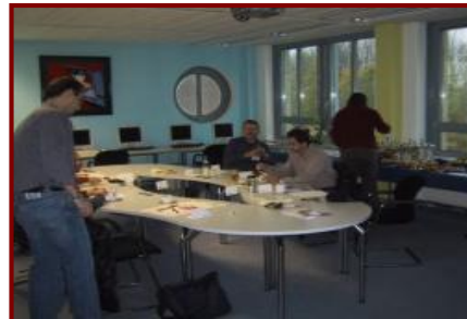
Schulungsraum „König Ludwig“