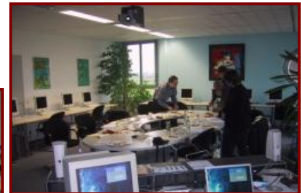
Schulungsraum „König Ludwig“